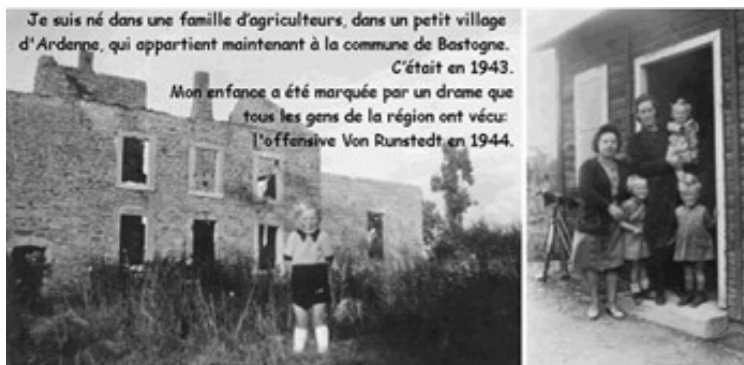
À droite avec la petite sœur dans ses bras : la maman et ses trois enfants

À la fin de la guerre (21 décembre 1944), en pleine offensive des Ardennes, les Allemands se vengent sur la population civile et huit hommes du village sont fusillés par un commando SS, dont mon père et son frère. J'avais un peu plus d'un an. Ce sont des débuts difficiles... Après la mort de mon père, ma mère a été accueillie dans une maison appartenant à la famille Deprez. J'ai toujours nourri pour mon père une profonde admiration. C'était un homme de caractère.